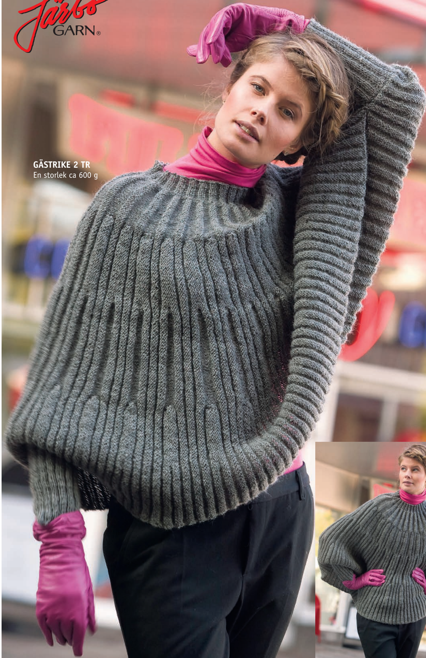
GÄSTRIKE 2 TR En storlek ca 600 g