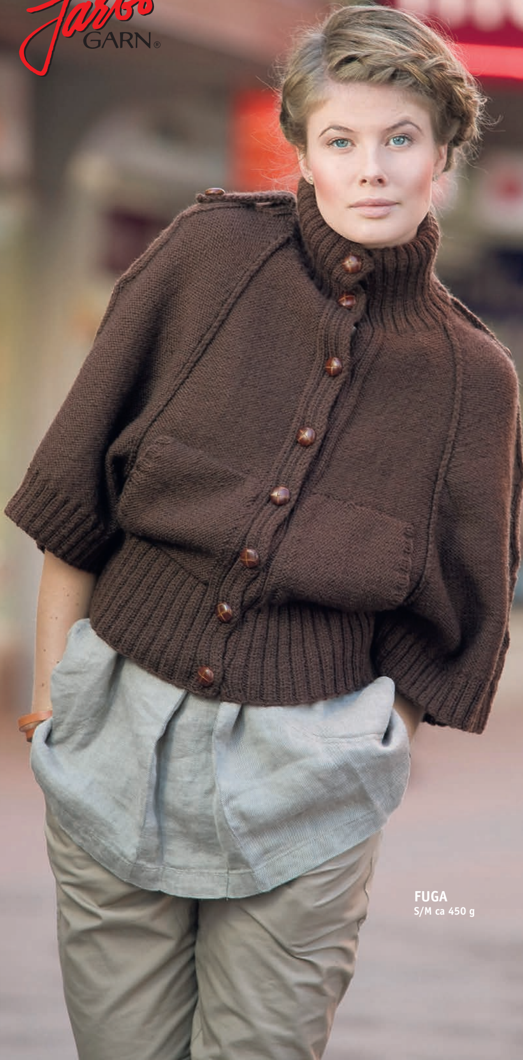
FUGA S/M ca 450 g