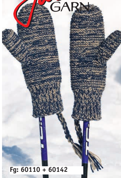
Fg: 60110 + 60142