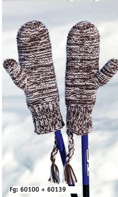
Fg: 60100 + 60139