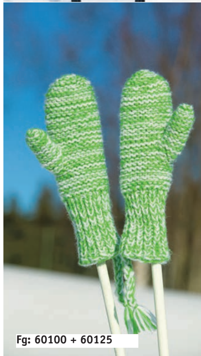
Fg: 60100 + 60125