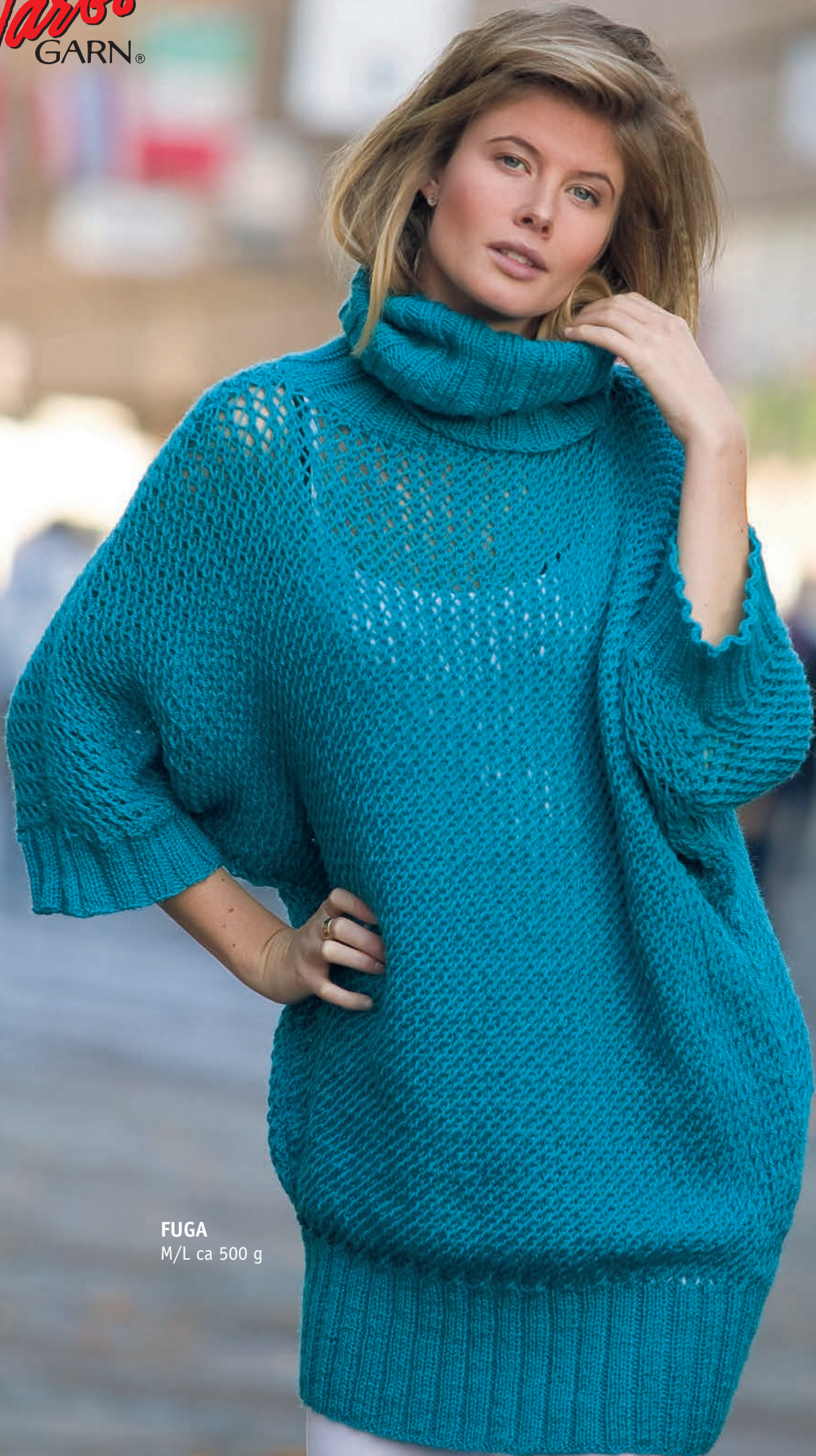
FUGA M/L ca 500 g