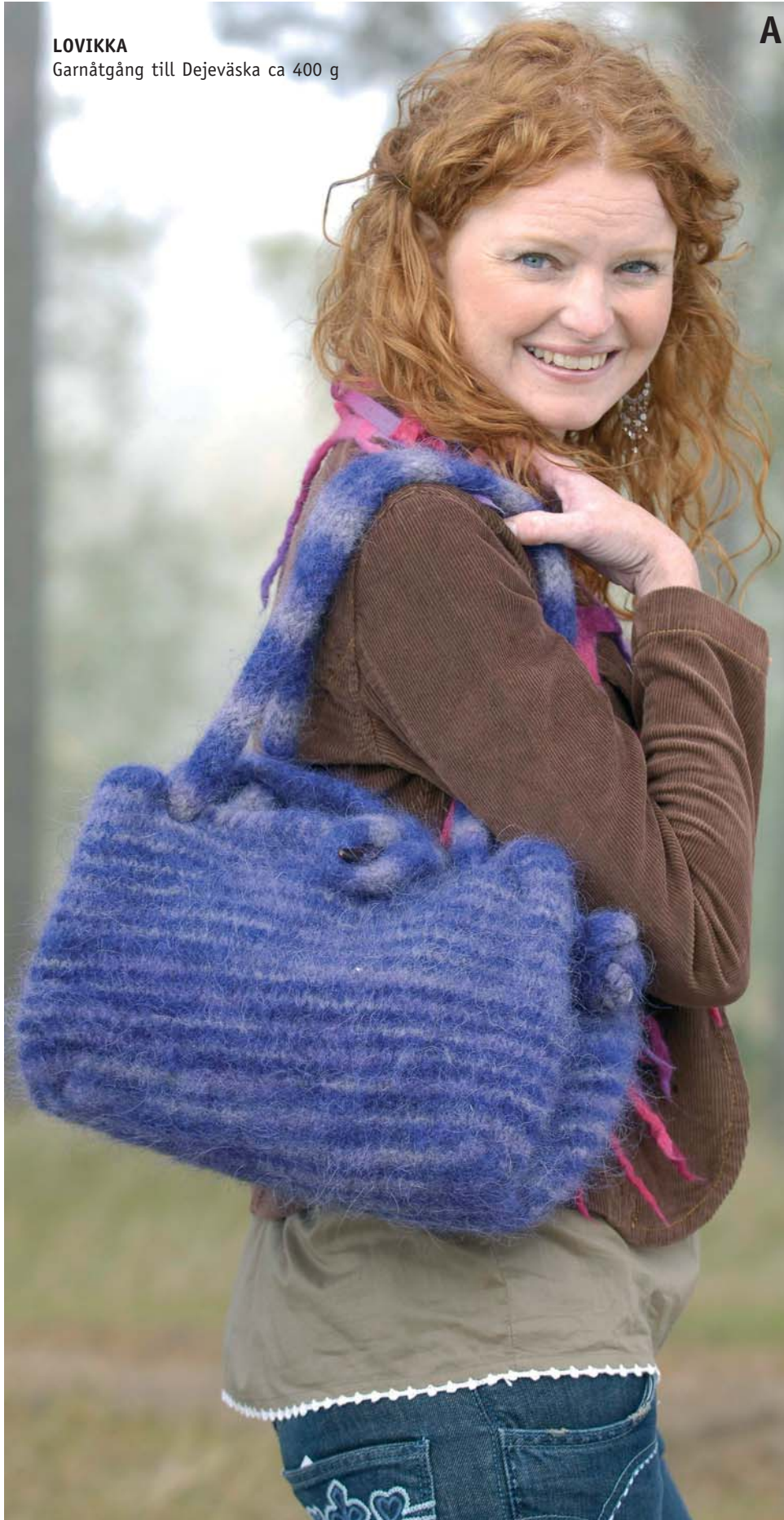
LOVIKKA Garnåtgång till Dejeväska ca 400 g